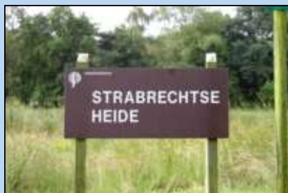
Winterserietocht vanuit Mierlo op 17 december: een vooruitblik