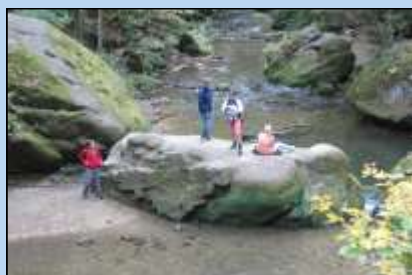
Verslag van het clubreis-weekend in Luxemburg